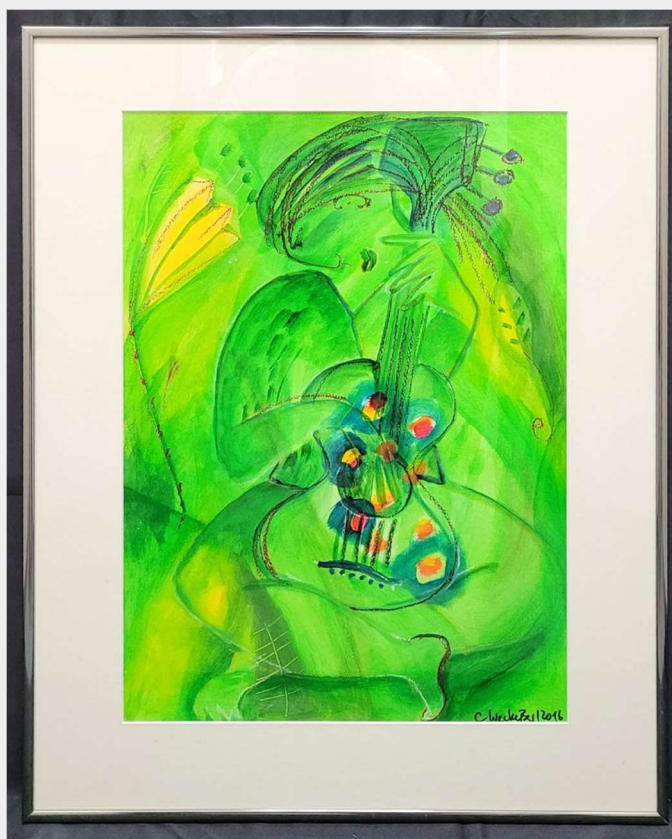
Bild CARLA WECKESSER Titel unbekannt 2016 handsigniert unter Glas gerahmt Gesamtmaß B/H: ca. 51 cm x 61 cm Motiv sichtbar B/H: ca. 35 cm x 47 cm 1 Stück