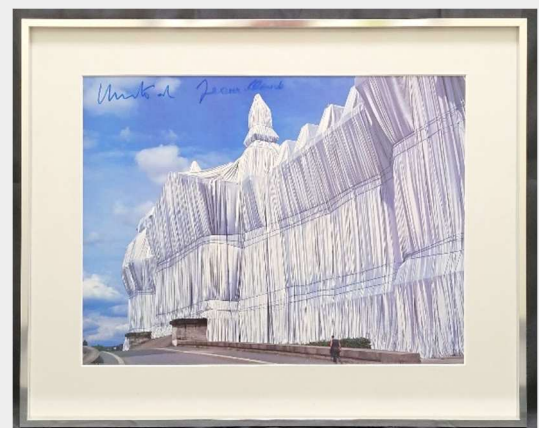
Bild CHRISTO I „Verhüllter Reichstag“, Blick von Südwesten handsigniert: Christo und Jeanne-Claude unter Glas gerahmt, Rahmen NIELSEN, Alpha, silber Gesamtmaß B/H: ca. 51 cm x 41 cm Motiv sichtbar B/H: ca. 39 cm x 29,5 cm 1 Stück